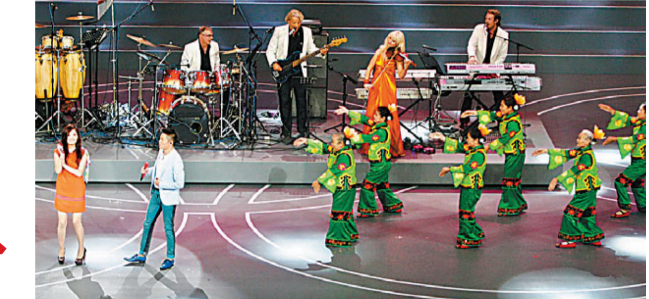
羅伯特樂隊和鳳凰傳奇用中英文共同演繹的《最炫民族風》，配上由獨具特色的「俏夕陽」舞蹈隊與西方留學生舞蹈團共同打造的現場伴舞，HIGH翻全場。

《北京歡迎你》誕生姊妹篇 四年前，北京奧運會群星版歌曲《北京歡迎你》一度風靡全國；四年後，其姊妹篇《北京祝福你》，又將作為歌會的主題曲和壓軸之作首次對外發布。「這可能是整場晚會最大的亮點。」中央電視台綜合頻道總監錢蔚說。 《北京祝福你》由成龍擔任總策劃，王平久作詞，常石磊作曲。它最終錄製成的MV，匯集了成龍、譚晶、劉德華、譚詠麟、張學友、郭富城、陳奕迅、李冰冰、范冰冰、韓庚、孫楠、李宇春等數百位一線明星。他們