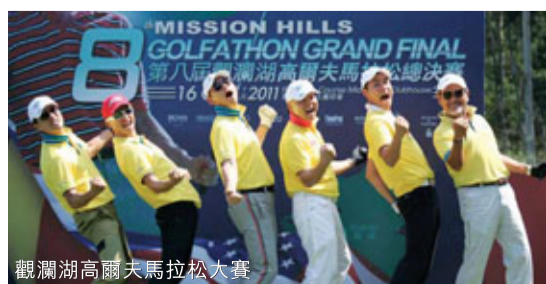
觀瀾湖高爾夫馬拉松大賽