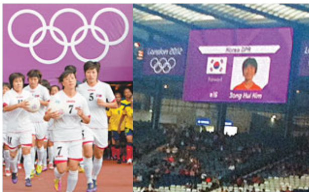
朝鮮女足進入球場。朝鮮隊員肖像旁邊出現韓國國旗。

作為倫敦奧運前哨戰的女子足球比賽前日率先舉行，倫敦奧組委同日亦搶先「擺烏龍」。在朝鮮對哥倫比亞的一場分組賽開始前，漢普頓公園球場上的大屏幕竟出現朝鮮球員配以韓國國旗的畫面，令朝鮮全隊大為震怒，更一度離場抗議。擾攘1小時5分鐘後才修復錯誤，比賽恢復進行，朝鮮最終以2:0勝出。