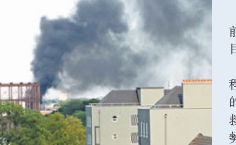
巴士失火後，現場濃煙滾滾。

一輛專門為倫奧提供通勤服務的巴士前日下午起火燒毀，大火很快被撲滅，目前尚無起火原因和傷亡的確切消息。事發於離倫奧主場館南面約10分鐘車程的坎寧鎮西漢姆巴士車庫，大火引起的滾滾濃煙在數英里外清晰可見。4輛救火車和20名消防員趕赴現場滅火，火勢很快得到控制。