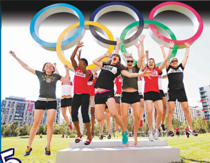
加拿大女籃隊在奧運村外的五環前拍照。資料圖片

根據英國品牌顧問公司Brand Finance發布的最新報告，奧運會品牌價值水漲船高，如今已飆至475億美元(約3,685億港元)，僅次於706億美元(約5,477億港元)的蘋果公司，是全球價值第2高的品牌，比價值474億美元(約3,677億港元)的網路搜尋巨擘Google更有價值。