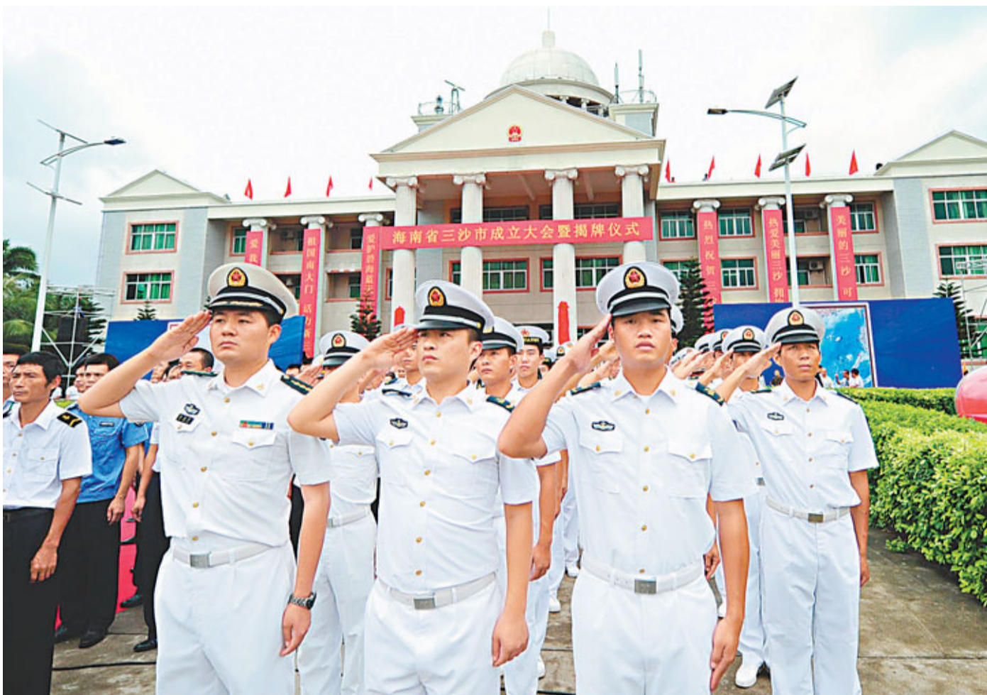
24日,海軍官兵在三沙市成立大會暨揭牌儀式升旗儀式上敬禮。

對於菲方提及黃岩島事件,並稱中方在南海護漁違反聯合國海洋法公約、要求中方尊重菲主權的言論,外交部發言人洪磊表示,黃岩島事件的經緯是清楚的。《聯合國海洋法公約》不是確定黃岩島領土歸屬的法律依據,不能改變該島主權屬於中國的事實。中方維護領土主權的立場是堅定的。中方也始終致力於雙邊協商處理事件。目前黃岩島形勢總體趨於緩和,希望菲方多做有利於局勢進一步緩和、有利於兩國關係健康發展的事情。