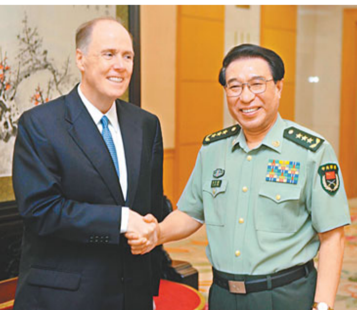
中央軍委副主席徐才厚(右)在北京會見美國總統國家安全事務助理多尼隆。

據新華網報道,徐才厚說,建立與兩國關係發展相適應的兩軍關係,符合中美雙方共同利益,是兩國防務部門和軍隊的共同責任。中美兩國防務部門和軍隊應本着尊重、互信、對等、互惠的原則,加強