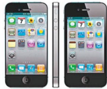
傳聞9月推出的iPhone 5(左)，屏幕比iPhone 4(右)大。

分析認為，今次消費者等待新產品推出的現象，與iPhone 4S推出前相似。目前市場有傳iPhone 5將於9月21日推出，ISI集團分析師馬歇爾估計，假如iPhone 5真的在年底推