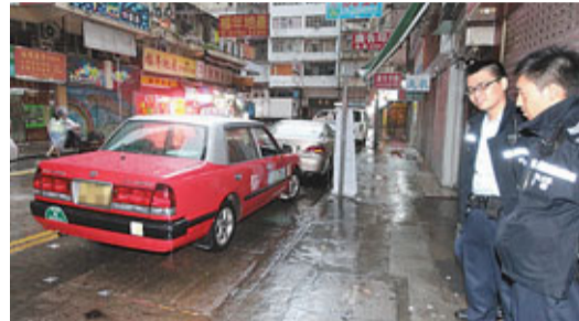
警員在的士被炸車窗盜竊現場調查。