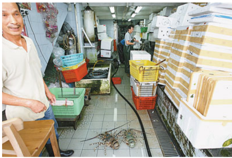
茶果嶺道遇竊海鮮公司,有10多隻大龍蝦被偷去。

而在同區荔枝角道159號,昨晨9時許,一名28歲姓林女報販返回上址報稱準備開檔營業期間,發現檔內24盒紙包菊花茶飲品不翼而飛,總值134元,懷疑被賊人趁風偷竊,於是報警。