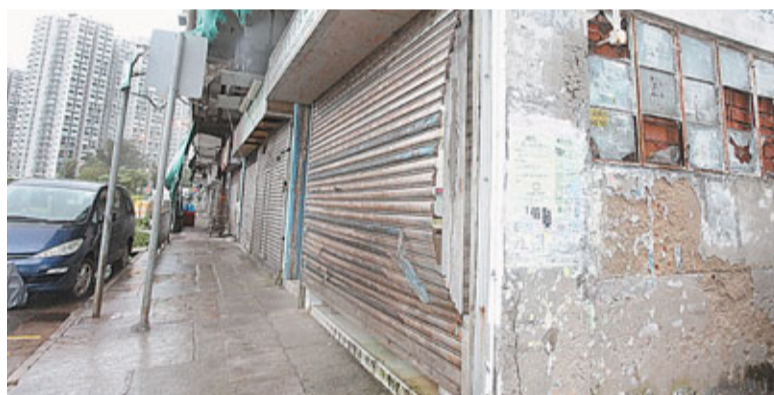
遇竊海鮮公司的鐵捲門,有一邊疑被烈風向外扯開,出現闊綽縫隙,疑被匪徒有機可乘。