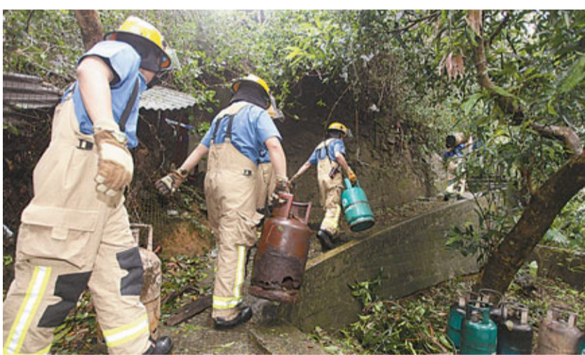
消防員在長坑村發生3級火警現場檢查多個石油氣罐調查。