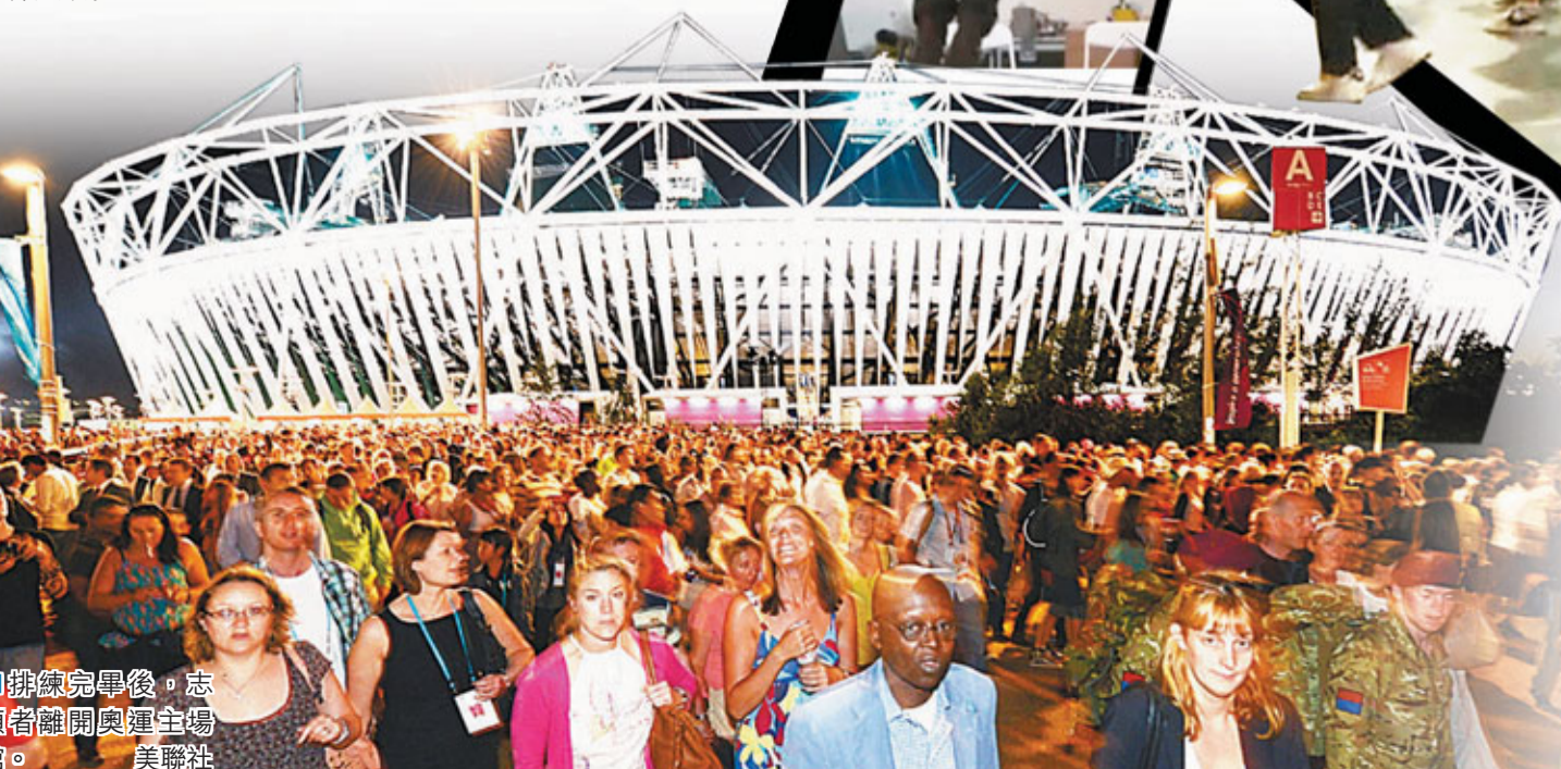
排練完畢後，志願者離開奧運主場館。