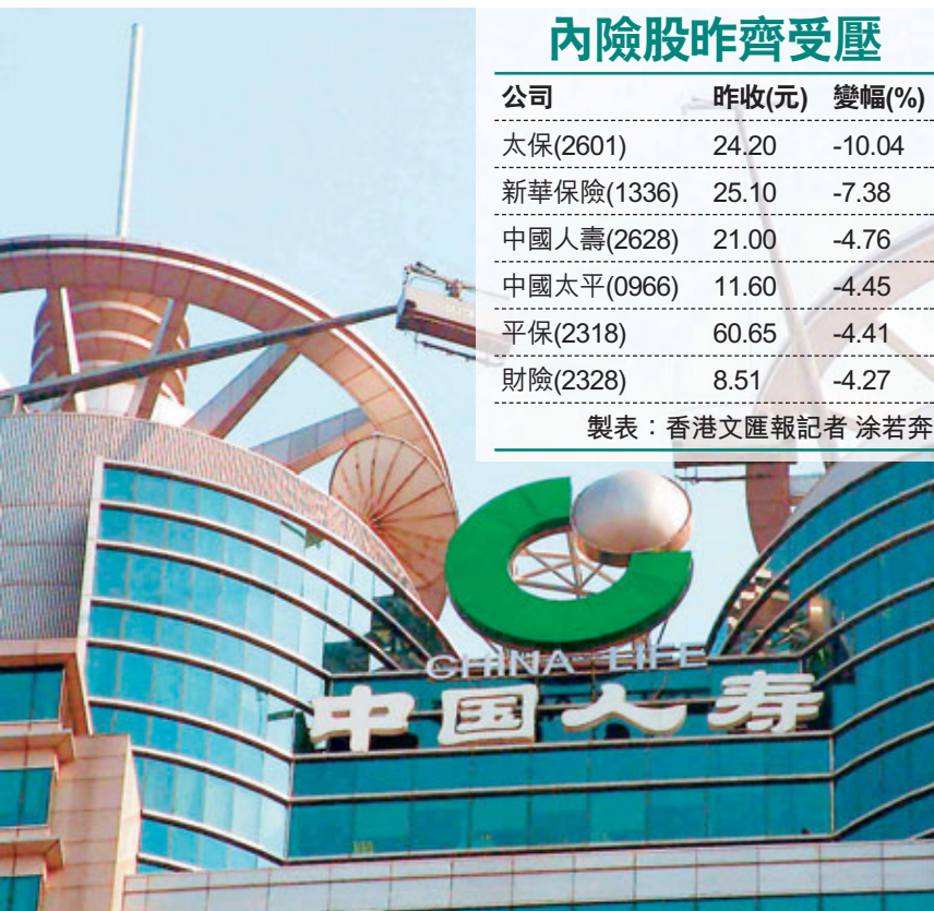
內險股今年盈利前景和股價均難以樂觀。

有券商指出，北京市承受重大財物損失，內險股今後將面臨巨額賠償，在商業車險報案已逾萬宗的壓力下，財險將首當其衝，短期內其股價隨時跌破8.44元的近期支持位，甚至有下見7.65元的可能。人壽保險業務佔比較大的國壽，