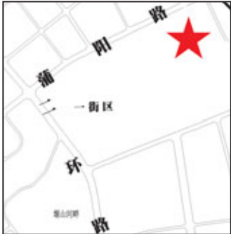
成都市國土資源局 2012年7月23日

市土地權權交易中心、成都農村產權交易所購買；建設用地指標價款按成都市公佈的年度最低保護價繳納。（諮詢電話：028-85987005、028-87050706） 六、本公告未盡事宜詳見出讓文件，並以出讓文件中附錄的行政主管部門的法定文件為準。請於2012年7月25日起到成都市土地交易市場招拍掛窗口領取出讓文件。 聯繫地址：成都市高新區天府大道北段966號天府國際金融中心7號樓 諮詢電話：028-85987887、85987885 詳情見：四川省國土資源廳網（http://www.scdlr.gov.cn） 成都市國土資源局網（http://www.cdslr.gov.cn） 成都市土地市場網（http://www.cdtg.gov.cn）