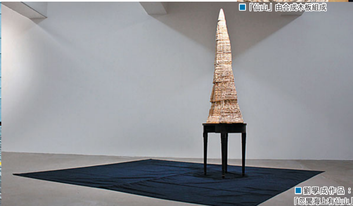
劉學成作品：「忽聞海上有仙山」