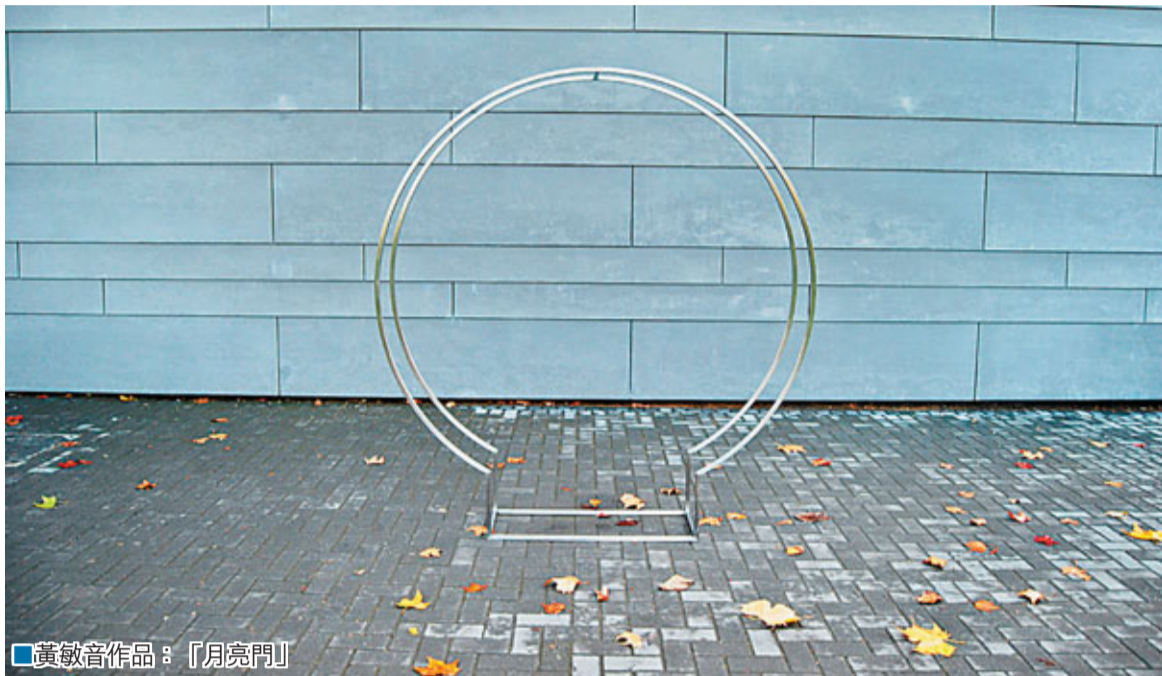
黃敏音作品：「月亮門」