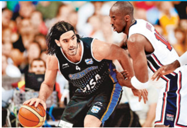
■高比拜仁(右)嚴防阿根廷前鋒斯科拉。