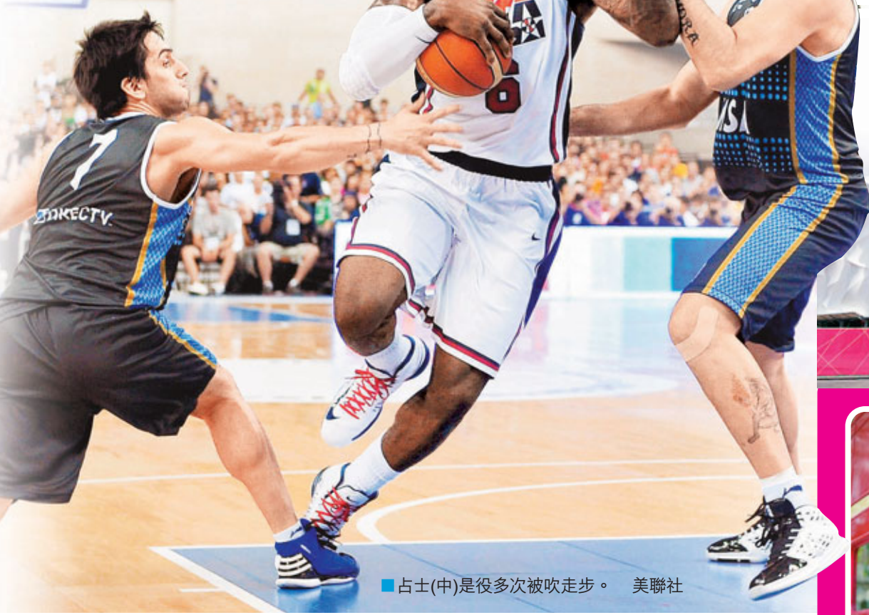
■占士(中)是役多次被吹走步。

美國男籃周日在巴塞羅那與阿根廷進行奧運熱身賽，球隊今仗特意披上「夢幻一隊」參加1992年巴塞羅那奧運會的復刻版球衣，可是表現與當年的夢幻一隊不可同日而語，只以86:80小勝阿根廷。距離倫敦開幕只餘3日，美國男籃在對阿根廷一役發覺國際賽執法尺度與NBA不同，尤其是走步違例，當中「大帝」勒邦占士就身受其害，多次被吹走步，賽後美國主帥克里澤維基(K教練)坦言經此一役，球隊已上了一課，獲益良多。