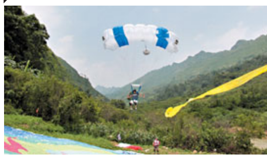
■選手落地前的瞬間。

香港文匯報訊(實習記者 溫志超 安順報導)21日上午，2012中國安順壩陵河大橋跳傘國際挑戰賽開幕。來自美國、意大利、德國、智利、新西蘭等15個國家和地區的30名世界一流低空跳傘選手，挑戰370多米高的壩陵河大橋。