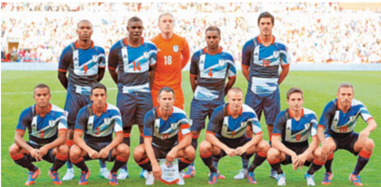
■英軍佔有主場之利。