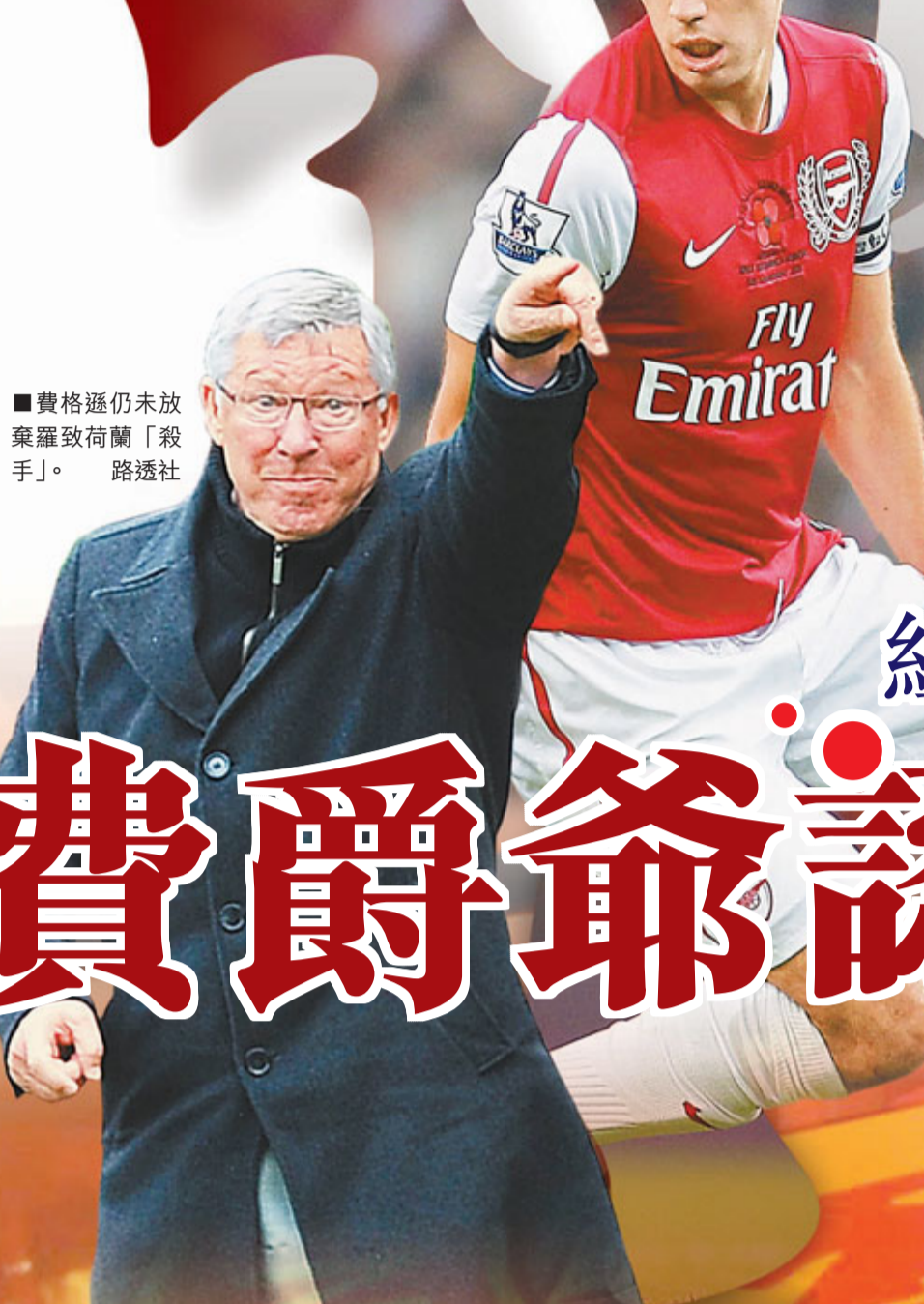
■費格遜仍未放棄羅致荷蘭「殺手」。