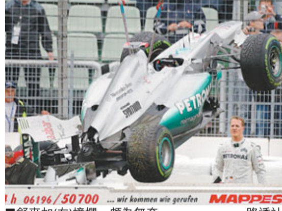
■舒麥加(右)撞欄，頗為無奈。