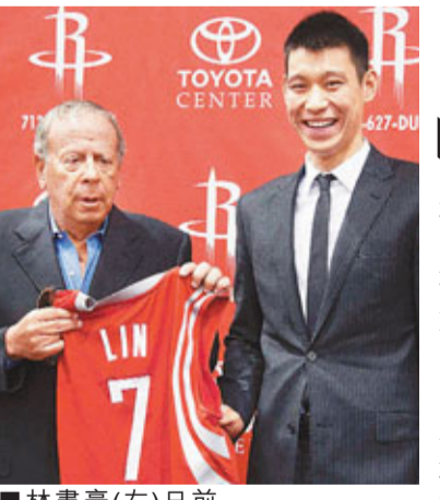
■林書豪(右)日前加盟火箭。