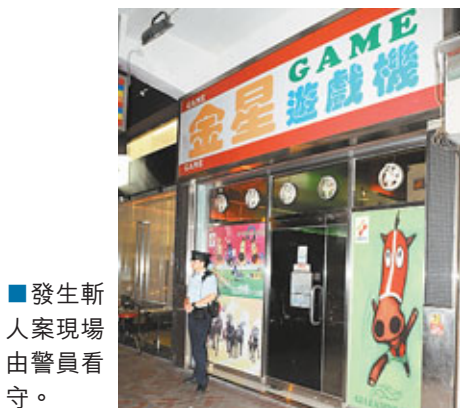
■發生新案現場由警員看守。