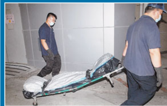
■男童遺體由仵工移送殮房。

發生男童意外墮樓死亡的悲劇後，屋邨住客均對事件感到震驚及議論紛紛，有住客表示，事發時沒有聽到爭吵聲，又認為大廈每層升降機大堂的欄杆不高，容易釀成危險，希望當局加高欄杆，避免意外再次發生。該邨互助委員會則批評景麗樓是邨內少數欄杆沒封頂的大廈，過往已多次發生墮樓事件，但業主立案法團一直拒絕跟進。