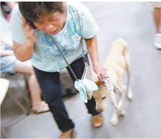
■一隻墮入捕獸器陷阱的唐狗由女主人領走。

漁護署對事件表關注，強調根據《野生動物保護條例》，任何人未獲漁護署授權，或未向該署申領狩獵牌照，擅自裝置或使用捕獸器，均屬違