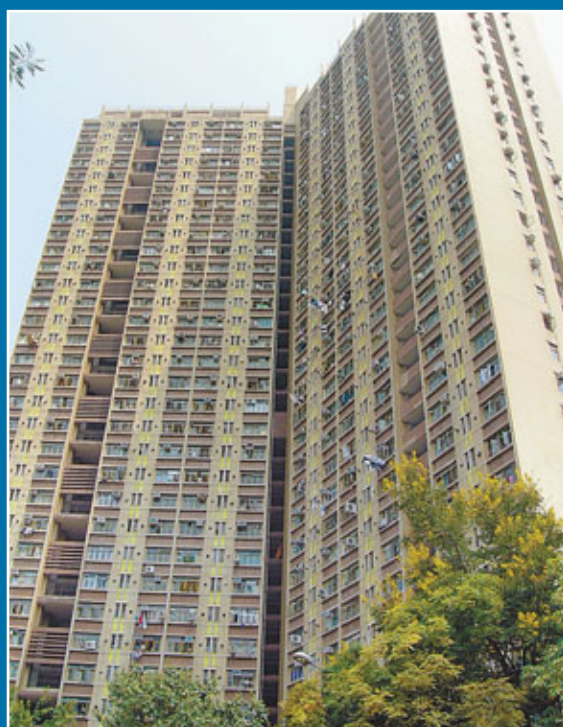
■發生7歲男童墮樓死亡悲劇的山景邨景麗樓。