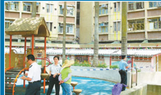
■7歲男童墮樓死亡現場封閉調查。