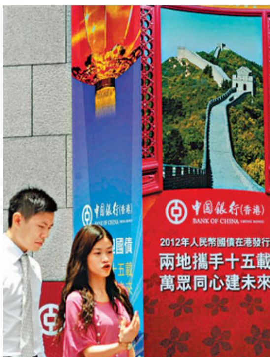
零售國債首日最高位收報100.15元人民幣, 沽出多賺15元人民幣。

另外, 今年發行的新iBond(4214)再創新高, 午後見106.45港元, 最後收報106.4港元, 升0.2港元, 成交額近900萬港元。而去年發行的iBond(4208)昨亦升0.35港元, 收報105.9港元。