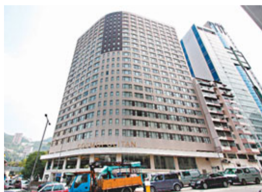
儘管來港遊客減少, 但三四星酒店需求仍熱, 租金反有上升。圖為遠東發展銅鑼灣麗都酒店。