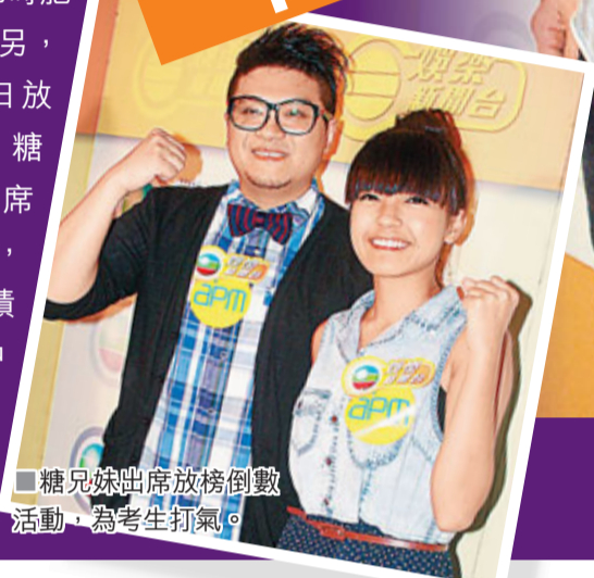
糖兄妹出席放榜倒數活動，為考生打氣。