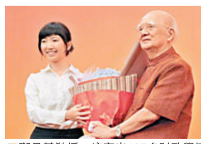
鄧子基教授，培育出107名財政學博士、300多名碩士。

香港文匯報訊（實習記者 李詩夢 廈門報導）今年是中国著名經濟學家、財政學家和教育家鄧子基教授從教的第65個年頭，廈門大學日前為這名資深教授舉行了從教65周年慶祝大會。作為國內重點財政學科點總學術帶頭人。從事教育和科研事業65年來，鄧子基先後出版了專著、譯著和教材75本，發表主要論文400多篇。1962年，他在《廈門大學學報》和《中國經濟問題》上連續發表3篇論文，在內地首次完整提出「國家分配論」的財政學理論主張，引起學界轟動，並逐漸成為中國財政學界主流學派「國家分配論」的標桿性人物之一。截至今年，鄧子基已為國家培養了107個財政學博士、300多名碩士。他說，「教