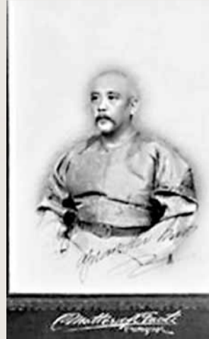
圖為袁世凱贈予莫理循的簽名照。

百年前英國《泰晤士報》駐華首席記者、袁世凱的洋顧問莫理循。他的名字曾在民國時期以「莫理循大街」的英文路牌釘在王府井大街南口路西店舖的牆上。1912年5月17日，由於不堪忍受當時的工資水平，他寫信給《泰晤士報》主編白樂爾，想借此獲得一筆退休金。但白樂爾的回信令莫理循很失望，因為按《泰晤士報》的規定，員工只有從年輕時即任職報社並且在任職期間因年老或疾病失去工作能力的情況下，才可能獲得一筆退休金，像莫理循這種中途加入又中途退出的情況，除非報社老闆鑒於其出色的工作而給予特別饋贈，否則莫理循是愛莫能助的。白樂爾的建議是，如果實在沒辦法，只能出售這些年來收集的藏書，儘管這是莫理循所不願意的。