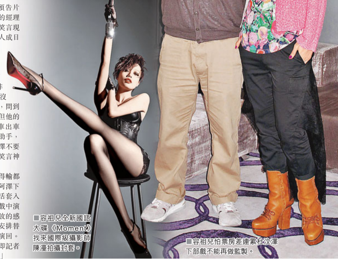
容祖兒全新國語大碟《Moment》找來國際級攝影師陳漫拍攝封套。

講到歌手做戲的電影票房都麻麻，祖兒自言無得輸都是因為未贏過，拍攝時也很擔心會蝕錢，怕連累阿澤下部戲不能再做監製，但阿澤告訴她只要將真實生活套入電影，投入真感覺就會演得好，她說：「今次在戲中演回自己，所以套用了很多生活在戲中，連含苞待放的感情觀都拿出來，而且我又錫又露背，本來公司有安排替身，但胡歌的按摩手勢非常舒服，最後都是自己演回。我和阿澤拍完後更成為了好朋友，賺咗了。」隨即記者指她賺理感情，她只尷尬傻笑：「唏，都話唔係。」