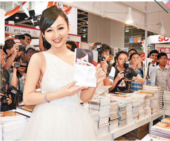
高海寧收起性感只穿上斜膊裙，仍吸引半百Fans到場，成為人數最多的藝人簽名會。