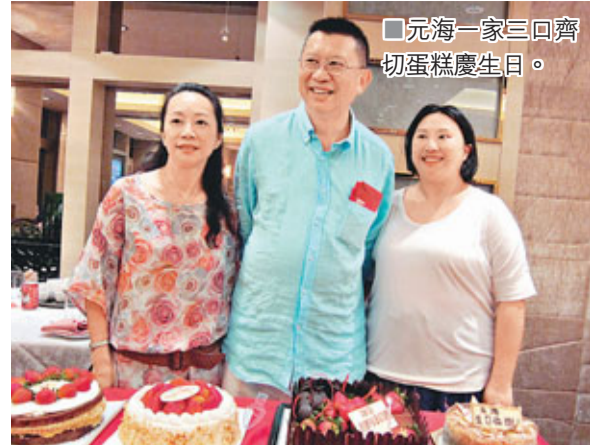
元海一家三口齊切蛋糕慶生日。