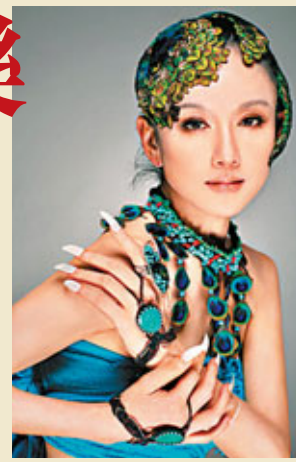
■楊麗萍將在上海藝術節上演自己的「收官之作」。

花節、首屆「樂谷微電影節」、上海七人制橄欖球錦標賽等多項大型活動。旅遊節更貼心為遊客們準備了各種優惠，屆時，上海市部分旅遊企業將舉辦大型優惠促銷活動，相較以往，其折扣力度更大、優惠幅度更多。上海市的部分景點還將從9月16日起，進行為期一周的門票半價活動。此外，作為上海旅遊節的經典項目之一的上海旅遊美食節，此次也將帶來諸多的優惠措施，讓廣大市民遊客在盡享海派美食饗宴之旅的同時，感受海派