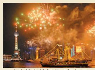
■上海旅遊節煙花照耀揚子江。

除了藝術節，上海旅遊節也將於9月15日至10月6日舉行。本次旅遊節以「2012中國歡樂健康遊」為主題，將舉辦國際郵輪大會、上海國際音樂煙