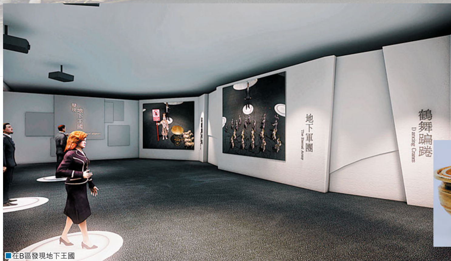
■在B區發現地下王國