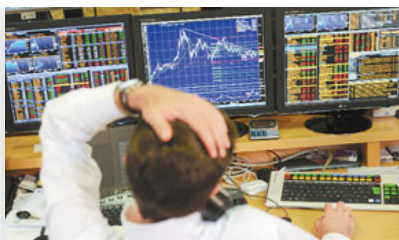
■葡國一家銀行的經紀看着電腦，無奈抓頭。

歐盟委員會及國際貨幣基金組織(IMF)前日表示，葡萄牙或可達成將赤字削減至國內生產總值(GDP)4.5%的目標，但由於該國經濟放緩以致稅收減少，無法達標的風險日增。IMF昨稱，歐元區正處於「危急」狀態，但可透過歐洲央行提高注資金額、發行歐元債券及盡快建立銀行業聯盟，以