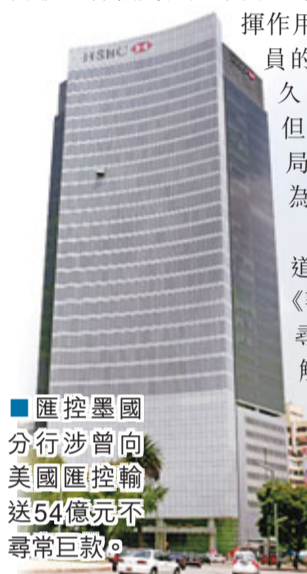
匯控墨國分行涉曾向美國匯控輸送54億元不尋常巨款。