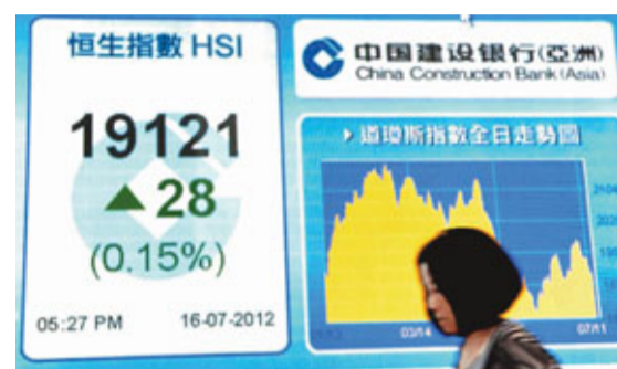
■ 港股昨升28點，收報19121點，全日成交僅352億元。

香港文匯報訊(記者 周紹基) 恒指隨外圍高開逾百點後，表現繼續乏力，更一度倒跌21點。港股全日收報19,121點，微升28點，成交額萎縮至只有352億元，是超過6個月的新低。市場人士表示，總理溫家寶一個月內兩番警告，指中國經濟困難還會持續一段時間，可見內地經濟下行的情況已比想像中嚴重，故即使下半年內地將推刺激經濟措施，但投資者現階段已無心戀戰，上證昨日更大跌1.74%，深圳指數跌幅更甚，相信港股後市易跌難升。