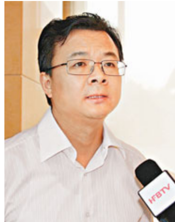
姚衛東表示，將充分利用出口加工區優勢，促進外向型經濟發展。

香港文匯報訊(記者 張長城 合肥 報導)合肥出口加工區日前通過國家9部委聯合驗收，即將封關運行。安徽省副省長花建慧、海關總署官員等出席驗收通過儀式，並為合肥出口加工區揭牌。