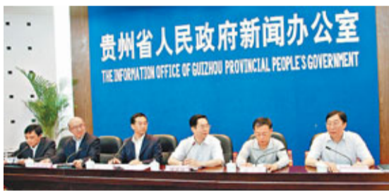
出席新聞發佈會的領導。

本次金博會主題為「營造良好金融生態、助貴州跨越發展」。旨在展示貴州金融成果促進金融創新，深化金融改革；創新投融資體制機制，搭建資金與項目「零距離」交流平台；營造「學金融、懂金融、用金融」的良好金融生態環境。 據悉，金博會主要由博覽會、高峰論壇、十佳評選三個部分組成。在佔地2萬平方米的現場，提供850個標準展位。金博會的六大看點包括：各家金融機