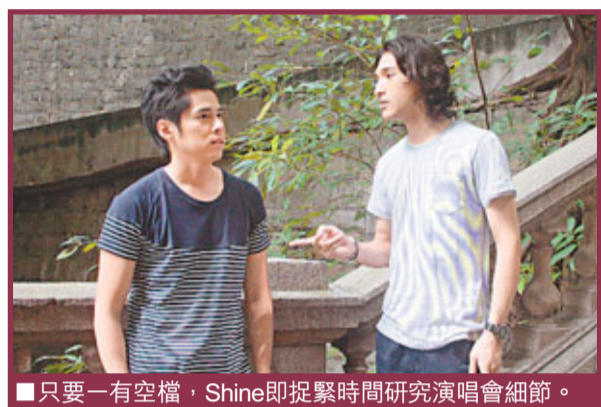
■只要一有空檔，Shine即捉緊時間研究演唱會細節。