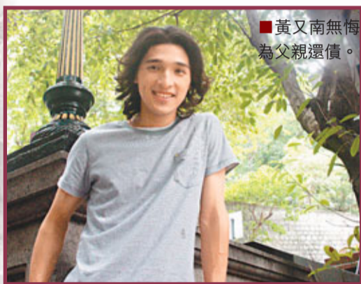
■黃又南無悔為父親還債。