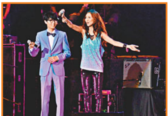
■方大同(左)馬來西亞開唱，特別嘉賓薛凱琪上台後立刻鼓勵觀眾為大同唱生日歌。

之後，方大同帶來了耳熟能詳的《玩樂》、《愛愛愛》、《Love Song》及《Singalongsong》等，並演唱新歌《每個人都會》及《BB88》，他還隨着輕快節奏在舞台兩側跳動，讓全場觀眾也站起來跟隨搖擺。最後方大同在唱完安哥曲《好不容易》後，讓這兩小時演唱會圓滿落幕。