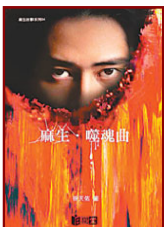
■天佑將推出第4本小說《麻生·噬魂曲》，探討精神病。