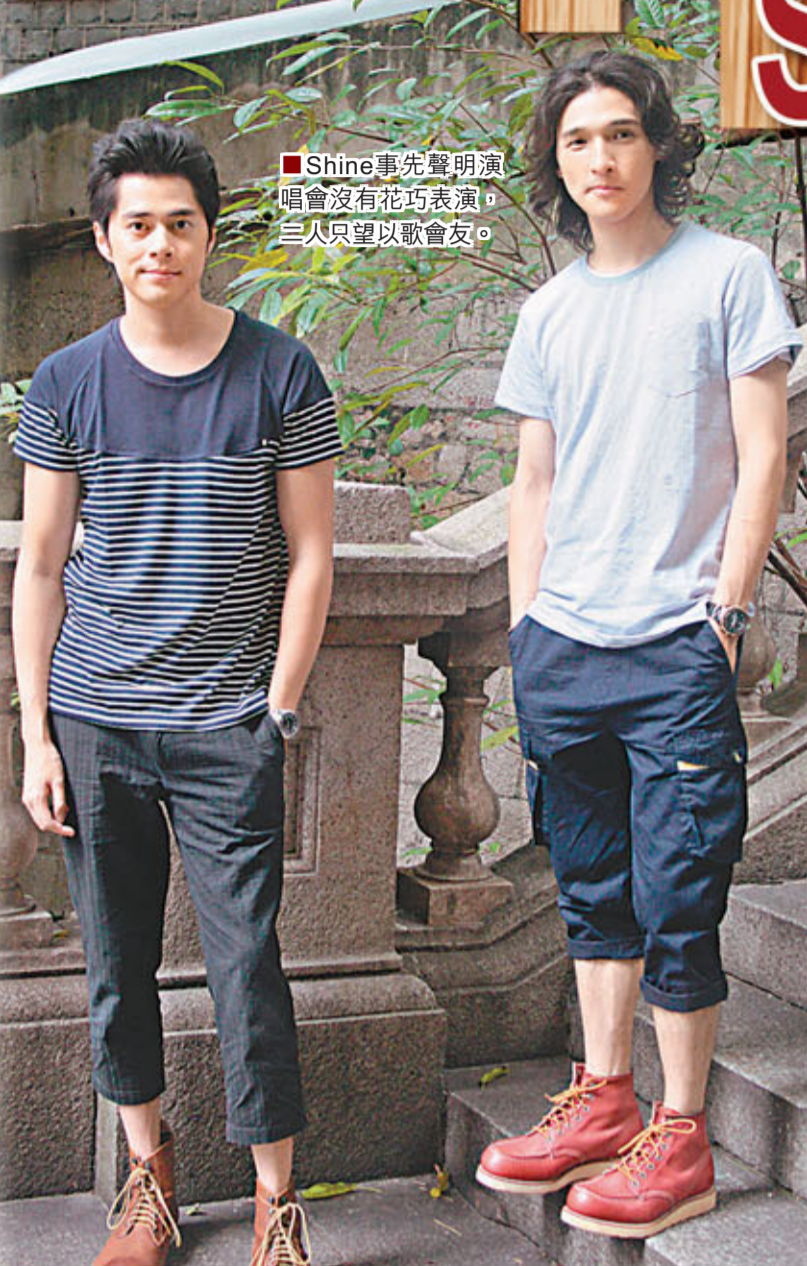
■Shine事先聲明演唱會沒有花巧表演，三人只望以歌會友。