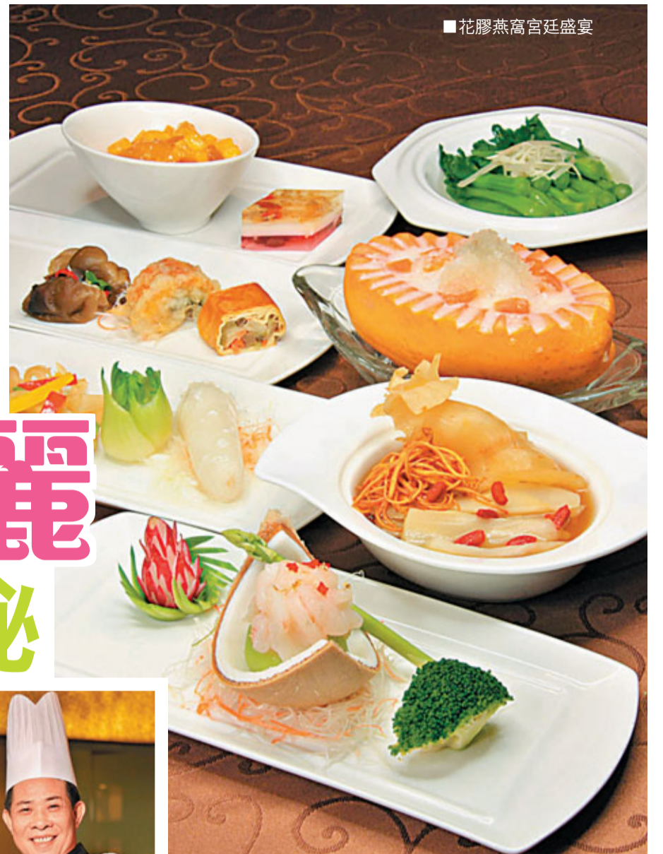
花膠燕窩宮廷盛宴