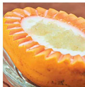
杏汁燕窩燉原個萬壽果