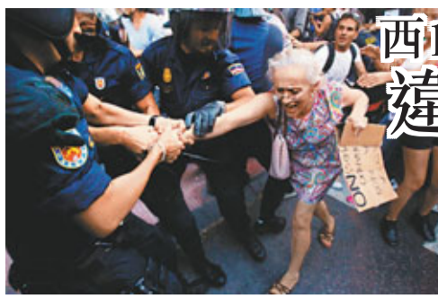
■數名防暴警察拉住一名參加示威的婆婆不放。