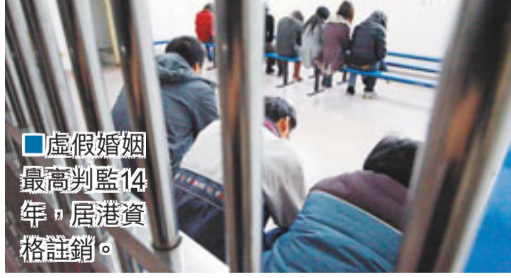
虛假婚姻最高判監14年，居港資格註銷。

入境處發言人稱，在去年12月的一次具規模打擊行動中，成功瓦解一跨境假結婚集團，並拘捕17男2女，當中包括2名骨幹成員；同時為繼續從源頭堵截及打擊中介人集團，會致力於留意報章上以「搵快錢」及「中港婚介」等字眼作招徠的廣告，當機立斷執法；而為了加強