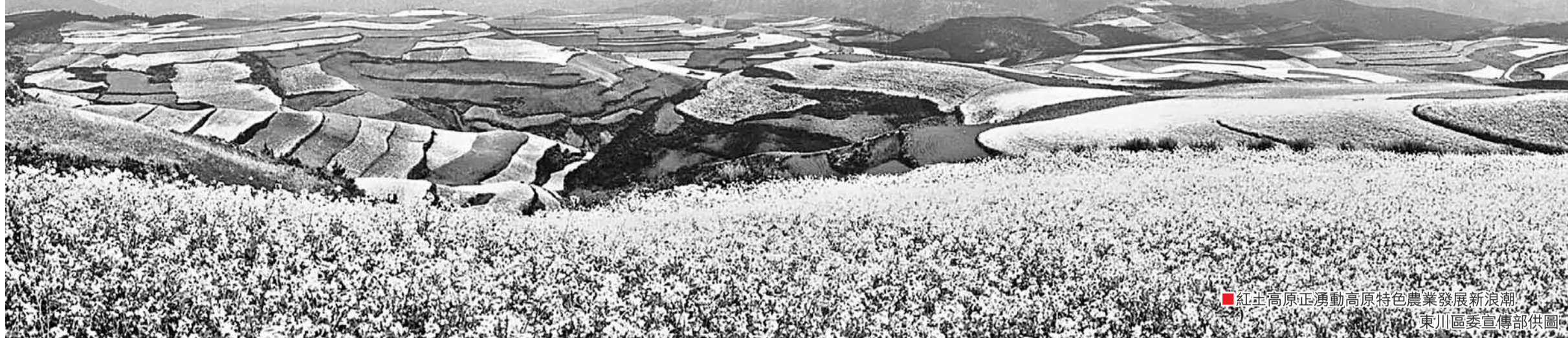
■紅土高原正湧動高原特色農業發展新浪潮