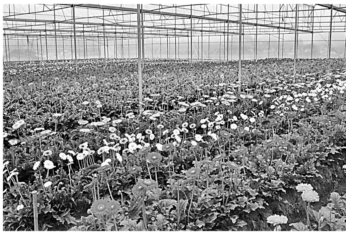
■石林錦苑花卉產業園現已成為石林台灣農民創業園的花卉核心區

牌」，加快形成關聯度高、帶動能力強、影響深遠的雲南高原特色農業產業和品牌。着力推進高原特色農業示範、農產品加工推進、農業科技支撐能力提升、農產品品牌創建、新型農業經營主體培育、農業基礎設施建設、城鄉流通服務體系提升、農產品質量安全保障能力提升「八大行動」。通過發展高原特色農業，5年後實現農牧業綜合產值達到5500億元以上，農民人均純收入達到10000元以上，農產品出口額達到35億美元以上，均較2011年實現翻番；糧食總產突破400億斤，畜牧業產值突破2000億元，農產品加工產值突破2000億元。以此探索發展雲南現代農業新路，補齊農業產業短板，增強農業競爭能力、促進農民持續增收，推動雲南跨越發展。