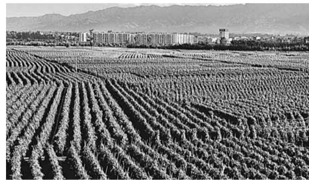
■蔬菜產業已成為元謀縣農增收的支柱產業