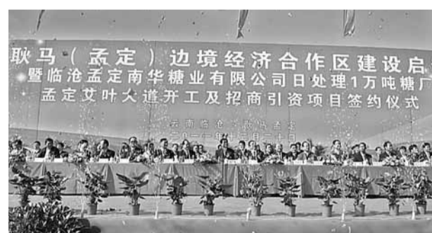
■臨滄良好的邊境、氣候和生物資源優勢，有着與緬甸發展對外農業交流合作的巨大潛力。

據了解，目前元謀縣獲得無公害農產品產地認定9.6萬畝，綠色食品產地環境質量達標面積15.6萬畝，出口蔬菜質量安全管理示範區面積21.05萬畝。元謀蔬菜暢銷全國24個省(市、區)的145個大中城市，部分農產品遠銷日本、德國、俄羅斯、新加坡等國家。