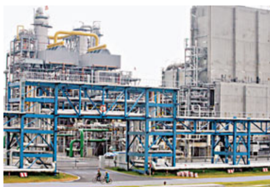
內地經濟減速,化工產品需求放緩,儀征化纖及上海石化首當其衝。資料圖片

中興通訊則預料上半年淨利同比跌60%至80%。公司指,上半年由於受歐債危機的影響,歐元以及很