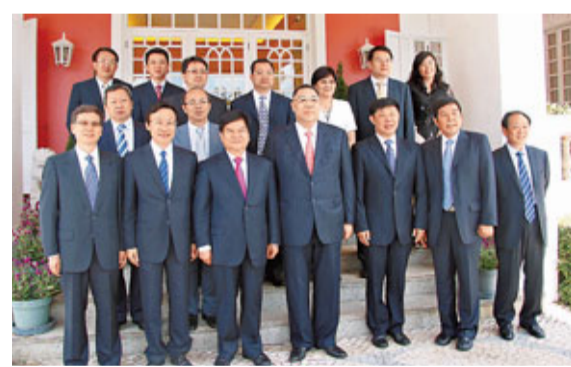
雲南省省長李紀恒率代表團一行拜會澳門特區行政長官崔世安後合影。

其四,擴大經貿合作。雲南在高原特色農業尤其是鮮花和蔬菜加工出口等方面具有明顯優勢,澳門具有聯繫廣泛的優勢,雙方企業可以在特色產品開發、營銷,以及拓展東南亞、南亞和葡語國家市場方面開展更加務實的合作。