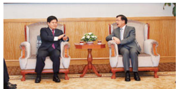
李紀恒(左)一行拜訪了外交部駐澳門特派員公署特派員胡正躍(右),雙方達成多項共識。

當日,李紀恒率雲南省政府代表團一行先後拜訪了外交部駐澳門特派員公署特派員胡正躍,和全國政協副主席何厚鏞,雙方就共同關心的問題深入交換意見,達成廣泛共識。