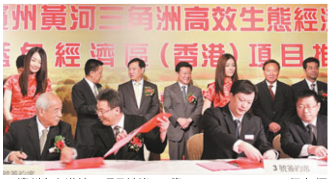
濱州市在港簽20項目涉資162億。

香港文匯報訊(記者 何冉)孫子故里濱州昨日在港舉辦「2012年濱州黃河三角洲高效生態經濟區暨藍色經濟區(香港)項目推介會」。據悉，此次濱州市共有20個項目簽約，涉資162億元(人民幣，下同)，其中合同金額73.5億元。簽約儀式上，10個項目集中簽約，涉及農業、紡織、畜牧、能源、電子等多個領域。濱州市長張光峰在接受本報記者專訪時表示，冀與香港在科技和人才兩大方面加強交流與合作，並繼續推動濱州優勢企業赴港上市。