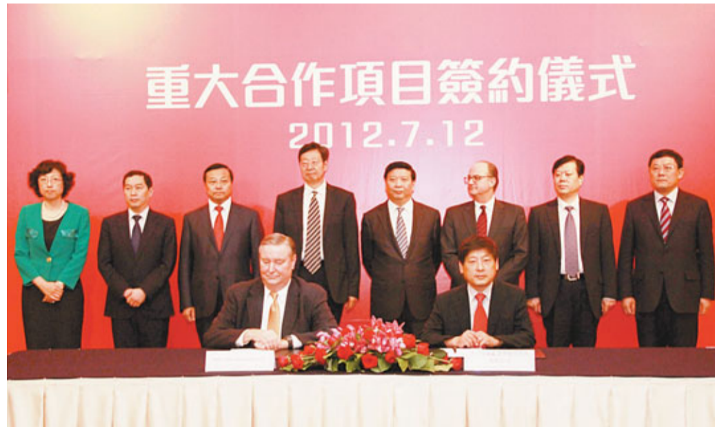
山東省長姜大明昨在港見證重大項目簽約儀式。

香港文匯報訊(記者 殷江宏、滕飛)山東省委副書記、省長姜大明昨日在港連續會見與該省有重大在談項目的多個海外大企業、商社負責人，並見證有關項目簽約。姜大明表示，去年山東實現生產總值4.5萬億元，僅次於廣東、江蘇居全國第三位。當前山東正在積極轉變發展方式，調整產業結構，不斷增強自主創新能力，為長遠發展積蓄力量。期待外商有機會多到山東考察，進一步加強合作，互利雙贏。