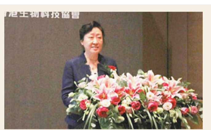
翟魯寧表示，山東省科技廳連續3年在港推介，雙方科技合作取得了豐碩成果。

姜大明省長昨日在港見證簽約的重大項目還包括馬來西亞金獅集團在青島的金獅商業綜合體項目、美國環球醫學發展公司在威海乳山的麥迪斯國際心血管病醫院項目、非洲礦業和山東鋼鐵合資的塞拉利昂唐克里里鐵礦項目以及沃爾沃德依茨合作生產發動機項目等。