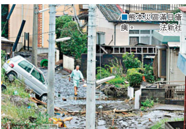
熊本災區滿目瘡痍。