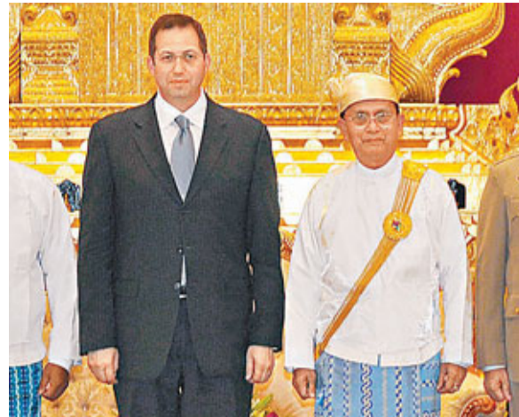
米切爾(左)會晤吳登盛。

美國資深亞洲事務官員、有「亞洲通」之稱的米切爾前日抵達仰光，就任美駐緬大使。報道指，時隔22年後，美再派大使赴緬，是伸出最新的橄欖枝。美國自1997年5月開始制裁緬甸，此後不斷擴展範圍，禁止美企投資緬甸，禁止進口緬產品、凍結部分緬金融機構資產，同時限制緬官員入境。近年緬致力推進政府轉型、政治改革以及民主進程。希拉里去年12月訪緬後，兩國關係開始改善。