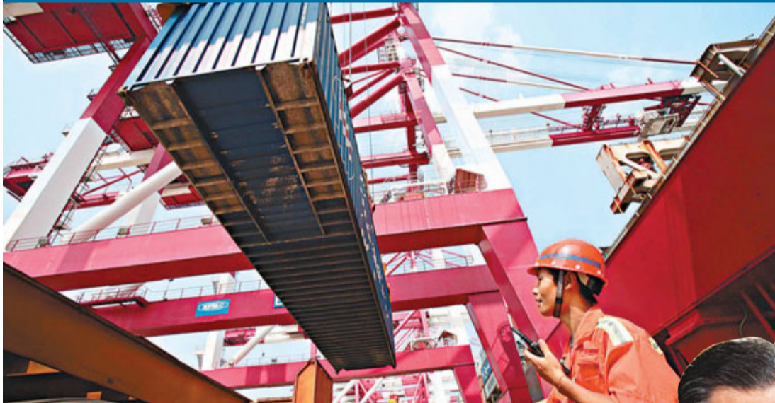
美國進口大量中國絲織品，加上限制高技术產品出口，擴大貿易逆差。上圖為中國安徽絲織廠，下圖為青島港口。