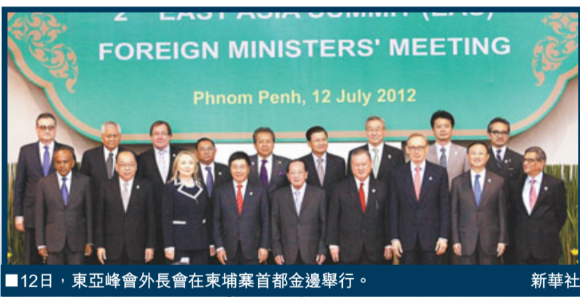
12日，東亞峰會外長會在東埔寨首都金邊舉行。

有關資料顯示，三沙漁業資源的潛在捕獲量約為500萬噸，每年的可持續捕獲量在200萬噸，而目前海南每年的捕獲量僅為8萬噸左右，開發前景巨大。