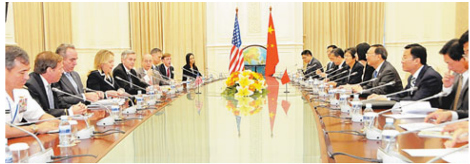
12日，中國外交部長楊潔篪(右四)在東埔寨首都金邊出席東盟地區論壇系列外長會期間會見了美國國務卿希拉里·克林頓(左四)。

楊潔篪說，中方主張從以下三方面入手，推動東亞峰會合作持續健康發展。第一，聚焦發展這一主題，把共同利益的蛋糕做大，讓發展的紅利惠及地區各國人民。第二，重點推進合作，我們應當堅持以東盟主導、循序漸進、協商一致、照顧各方舒適度等為特徵的東亞合作方式，推動地區合作不斷向前邁進，中方積極參與峰會確定的六大重點領域合作。第三，共同致力於維護地區和平與穩定。