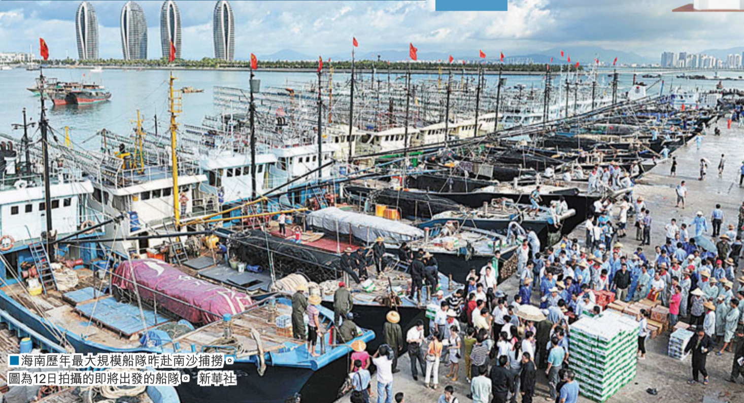
海南歷年最大規模船隊昨赴南沙捕撈。圖為12日拍攝的即將出發的船隊。