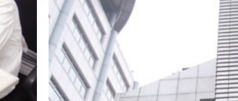
北京友誼醫院

當記者問到，取消藥品加成會不會影響醫生收入時，曹邦偉回答說，雖取消了藥品提成費，但專家的醫事服務費比以前有大幅度提高，醫生的價值得到進一步體現。「這個月還未結束，沒有工資。但我想收入不會比以前少。」