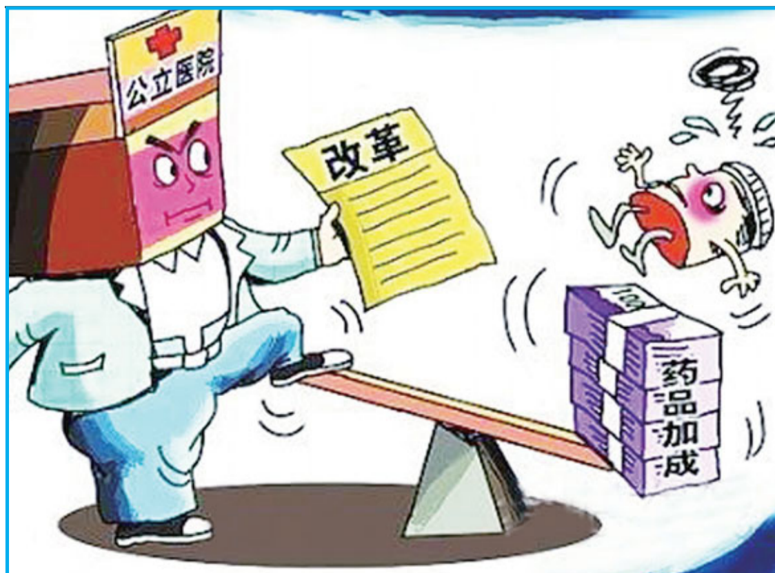
圖改漫畫：公立醫院取消藥品加成。(網絡圖片)

在醫院管理體制方面，推動「管辦分開」，組建成立全國首家省級醫院管理局，對市屬22家大醫院行使舉辦職責。在北京友誼醫院、朝陽醫院、同仁醫院、積水潭醫院、兒童醫院進行了醫藥分開、法人治理運行機制、醫保付費機制等試點。