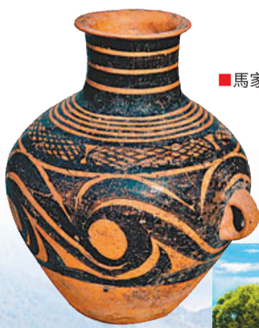
■馬家窯出土的彩陶