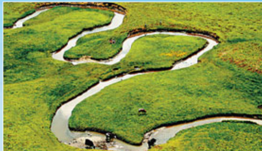
■岷縣狼渡濕地草原