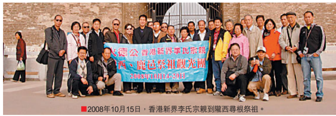
■2008年10月15日，香港新界李氏宗親到隴西尋根祭祖。

日至12日舉辦的「渭源生態文化旅游節」；8月13日至18日舉辦的「中國書畫藝術之鄉——通渭旅遊文化藝術節」；8月19日至21日舉辦的「中國·隴西李氏文化旅游節」。屆時，定西人將備上最甘甜的美酒、最豐富的特產、最迷人的風光，迎接遠道而來的朋友。