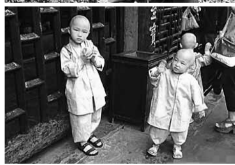
「三個小和尚」萌紅遍網絡。