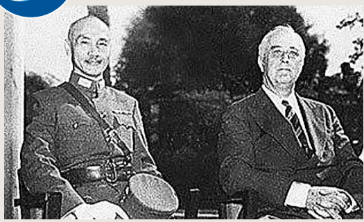
開羅會議期間，蔣介石（左）、羅斯福合影。

在抗日戰爭時期的中美關係史中有一種說法：1943年11月開羅會議期間，美國總統羅斯福曾給史迪威下令要他採取必要的手段，將蔣介石從肉體上消滅掉。這種說法近年來廣泛出現在抗日戰爭題材的紀實文學作品中。