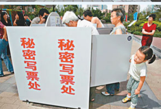
■上海居委會實行民主自治的管理模式。 資料圖片