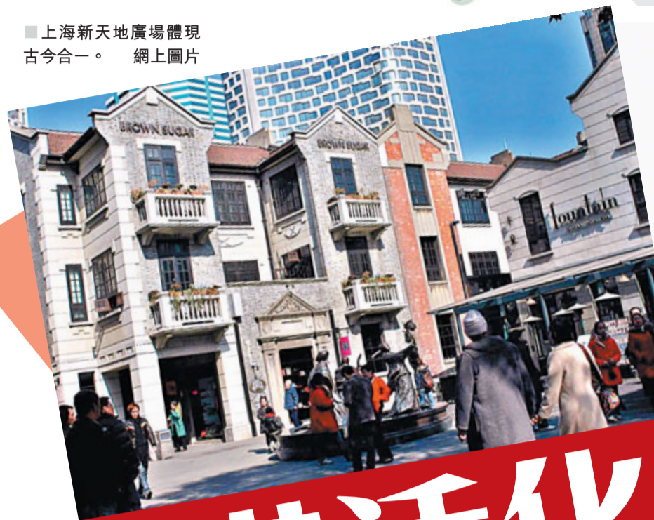
■上海新天地廣場體現古今合一。 網上圖片