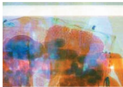
■機場掃描發現偷運嬰。