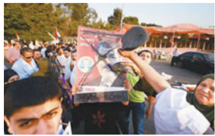
■軍方支持者上街示威，並用鞋拍打穆爾西畫像。

埃及新任總統穆爾西周日下令，被最高憲法院勒令解散的人民議會(國會下院)恢復工作，由伊斯蘭勢力主導的議會昨日隨即召開會議。部分非伊斯蘭勢力議員批評穆爾西此舉是「憲制政變」，分析則指，今次衝突標誌着埃及軍政鬥爭表面化。