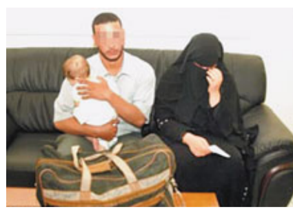
■當局拘捕涉案夫婦。