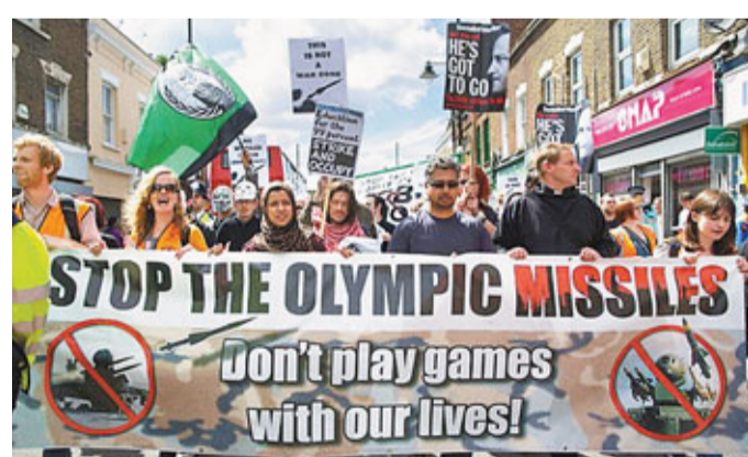
■倫敦居民上月示威，反對屋頂設置導彈。