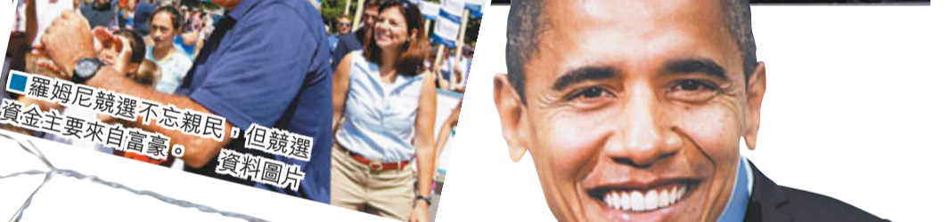
■羅姆尼競選不忘親民，但競選資金主要來自富豪。

籌款戰連敗兩月 奧營打危機牌撲水 美國總統奧巴馬和共和黨總統候選人羅姆尼陣營，前日分別公布上月籌款紀錄，其中羅姆尼共籌得1.06億美元(約8.21億港元)，多過只籌得7,100萬美元(約5.5億港元)的奧巴馬。雖然奧巴馬籌款總額仍領先，但連續兩月被拋離，他開始大打「危機牌」，呼籲選民慷慨解囊，助其連任。 共和黨與大企業關係密切，羅姆尼的籌款亦大多來自億萬富豪，雖然他宣稱籌款有94%來自基層小額捐款，但實際上這些小額捐款只籌得2,200萬美元(約1.7億港元)，其餘都是來自富豪。民主黨則將目標鎖定中產階級，奧巴馬提出延長中產減稅措施，用意明顯，但只靠小額捐款始終難與羅姆尼抗衡，奧巴馬最近也開始致電超級富豪撲水。