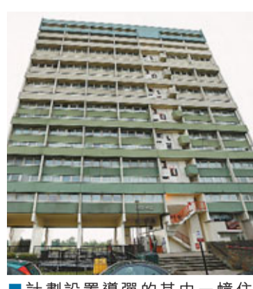
■計劃設置導彈的其中一幢住宅。

英國國防部以防範倫敦奧運受恐怖襲擊為由，擬於倫敦6個住宅區屋頂設置地對空導彈，並派員24小時駐守。然而國防部事前沒跟大樓居民商討，惹來不滿，認為此舉反而會令他們成為恐怖分子攻擊目標。其中一座大樓住戶以人權法入稟法院，指有權「和平地安坐家中」，要求國防部撤回計劃，但遭法庭否決。