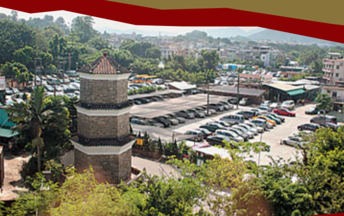
縱覽聚星樓和屏山鄉

屏山文物徑位於香港新界元朗區屏山鄉。它蜿蜒約1公里,將香港新界「五大家族」之一的鄧氏家族歷年來修建的中國傳統建築連接起來,包括鄧氏宗祠、上璋圍、觀廷書室、洪聖宮、聚星樓及多座傳統建築。