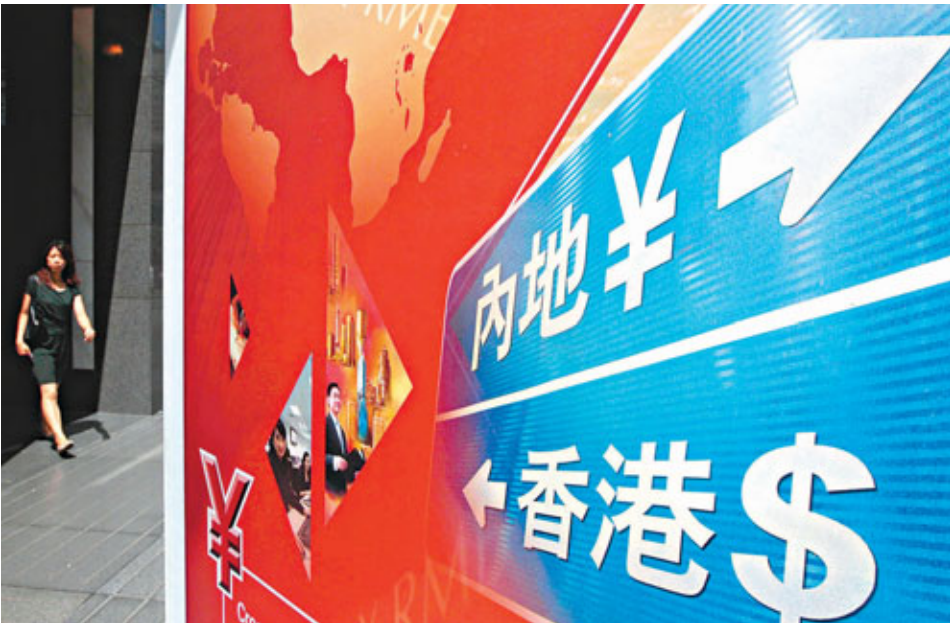
■隨着ETF產品陸續出現，兩地資金往來更趨密切。