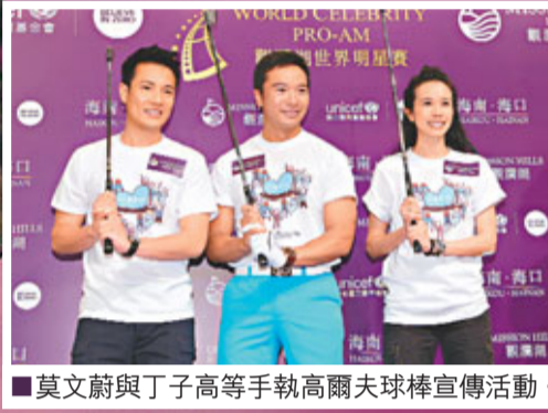
莫文蔚與丁子高等手執高爾夫球桿宣傳活動。