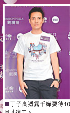
丁子高透露千嬅要待10月才復工。