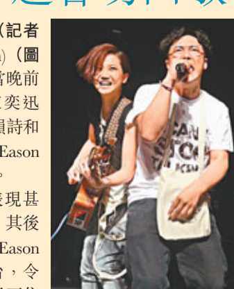
盧凱彤(圖左)的4場演唱會前晚圓滿結束，當晚前來捧場的圈中人不少。

香港文匯報訊(記者 李思穎)盧凱彤(Ellen)(圖左)的4場演唱會前晚圓滿結束，當晚前來捧場的圈中人不少，分別有陳奕迅(Eason)(圖右)和爸爸陳裘大、何韻詩和菇母、菇母、林二汶和林一峰等，Eason突然上台做嘉賓，令Ellen大為驚喜。剛從內地返港的Eason，當晚表現甚high，又在座位上大呼「好正呀」，其後到「安哥」部分，正當她準備演繹Eason的《愛是懷疑》，Eason突然跳上台，令Ellen也嚇了一大跳，Eason笑說是不忍不上台做和音，並向Ellen索吻，又笑台下觀眾擲不到這個香吻，結果Ellen大方在Eason臉上輕吻。Eason又不忘搞爛gag，令全場笑彎肚皮。Eason表示不去看薛凱琪(Fiona)的演唱會也要來這捧場，但Eason最後也連走兩場，趕到Fiona演唱會做嘉賓。Ellen演出時被契哥一出場便撞壞鋼琴，要立時「搶救」鋼琴，幸而最後有驚無險。當晚Ellen再向已病逝的表姐獻上《遊樂園》一曲。Ellen接受訪問時透露表姐的家人也有來捧場，阿姨在後台還攬住她喊。問她的男友可有來？她快而準的說沒有，因沒男友。