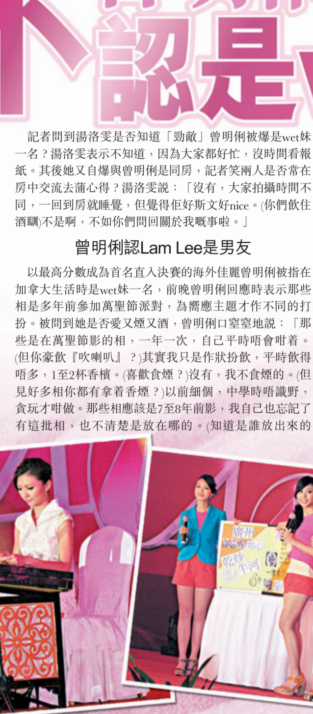
佳麗們介紹廣東美食。