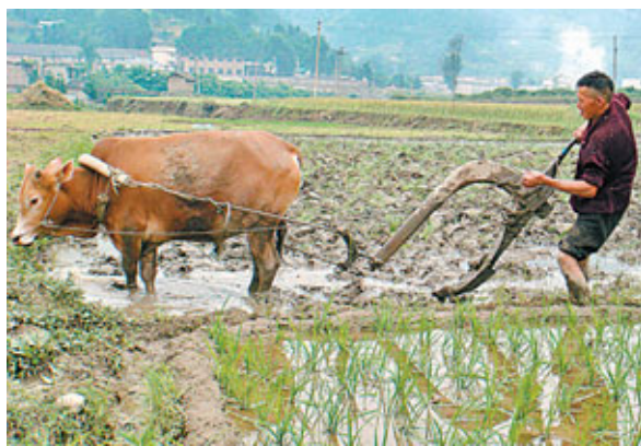
農民獲分配的田地面積越來越少。資料圖片