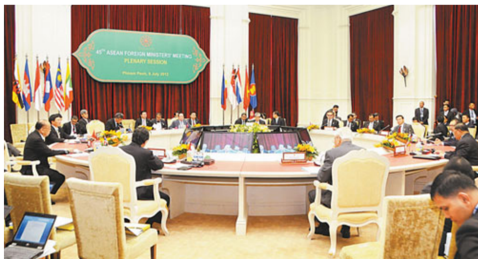
第45屆東盟外長會議9日在柬埔寨首都金邊開幕，來自東盟十個國家的外長和各國使節出席。

香港文匯報訊(記者 趙一存 北京報導)第45屆東盟外長會議昨日在柬埔寨首都金邊開幕，來自東盟十個成員國的外長和負責安全事務的官員出席了會議，各方將就東盟在2015年建成東盟共同體等事務協調立場和主張。據悉，東盟日前完成了制定「南海行為準則」(COC)草案的核心內容，草案的最終稿預計將在本次會議期間提交中國。中國外交部發言人劉為民表示，中方已多次表示，願意同東盟國家在條件成熟時探討制訂COC。