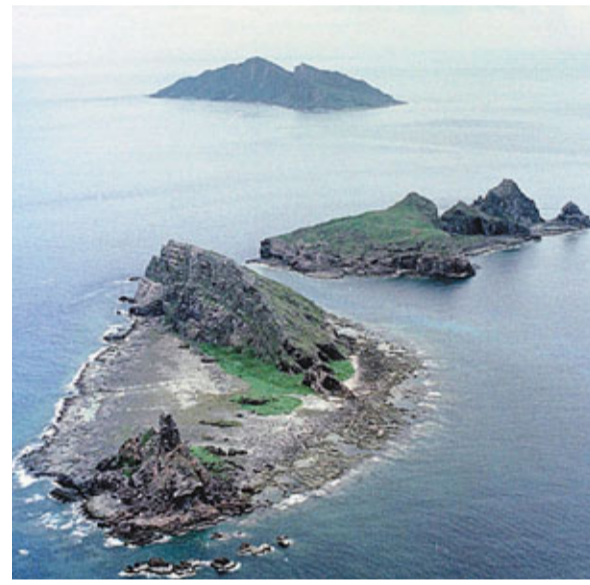
日本政府日前宣稱將「國有化」釣魚島，北京《環球時報》發表社評稱，中日就釣魚島爭端很可能會再次升級。圖為釣魚島及周邊島嶼。資料圖片

文章還直指中國有必要認真考慮重提整個沖繩的主權問題，以此牽制日本的釣魚島態度。而且從長遠看，沖繩出現對日本的離心主義傾向並非沒有可能。中國不應懼與日本互相拆領土完整的台。文章最後強調，中國需要幾個讓日本有所反思的行動，而不僅僅是外交抗議。