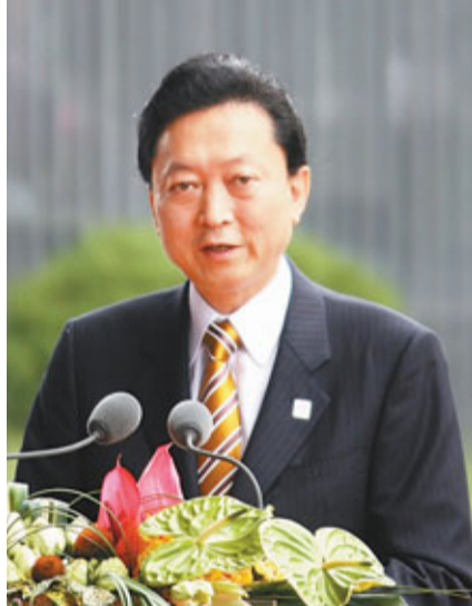
日本前首相鳩山由紀夫希望中日兩國建立「獨立自主、共同生存」的國與國關係。網上圖片

1884年(明治十七年)，居住在那霸(現屬沖繩)的古賀辰四郎在「久場島」(即釣魚島)採集信天翁羽毛和從事海產事業。回到那霸後，他向沖繩縣廳提出了土地借貸申請，將全島租借給自已一人。 1895年(明治28年)，日本在釣魚島建立標樁，以此作為「先佔」的憑據，1月內閣通過決議，將釣魚島(日稱「尖閣列島」)編入日本領土。 1972年，古賀辰四郎之子善次將釣魚島以4,600萬日圓「轉售」給實業家栗原國起。 2002年，栗原家人簽署合同將島嶼「租借」給日本防衛省。近年日本海上保安廳對企圖登島人士，皆動用艦艇和飛機的海空攔截及驅趕，以此證明日本已對釣魚島作「實效性統治」。 對於日方對釣魚島的任何聲稱和行為，中國外交部已多次重申釣魚島自古屬中國固有領土，中國主權不容侵犯。 ■香港文匯報資料中心