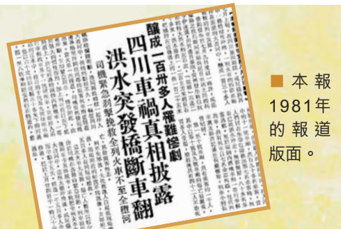
本報1981年的報道版面。

米鐵路橋攔腰衝斷，連同兩段橋樑一起沖入大渡河中，但橋剛被沖斷不久，一列從四川格里坪開往成都的旅客列車駛經該處，因剎車不及，4個車廂墮江，2個車廂掉在河邊，釀成超過200人死亡或失蹤的中國鐵路史上，旅客傷亡最為慘重的事件。