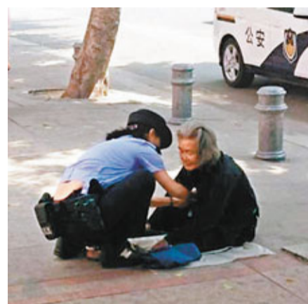
女警幫乞討老人穿衣服。

7日下午，這名任職於台江公安分局茶亭派出所警務中隊的女警在微博上回應：「今天接到報警說，有裸女在乞討，過去