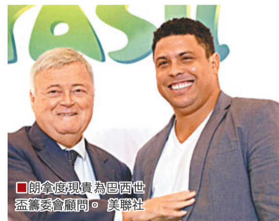
朗拿度現為巴西世盃籌委會顧問。

朗拿度還談到了目前C朗和美斯的世界最佳球員之爭，「外星人」表示自己雖然在心態上更傾向於