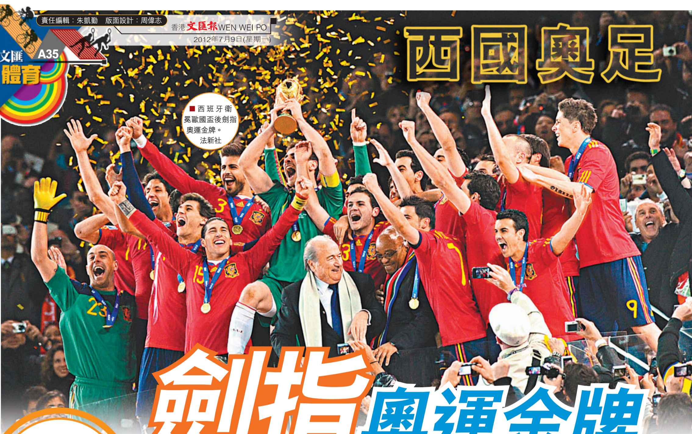
西班牙衛冕歐國盃後劍指奧運金牌。