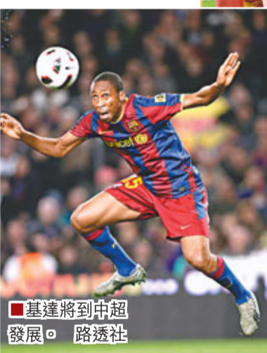
基達將到中超發展。