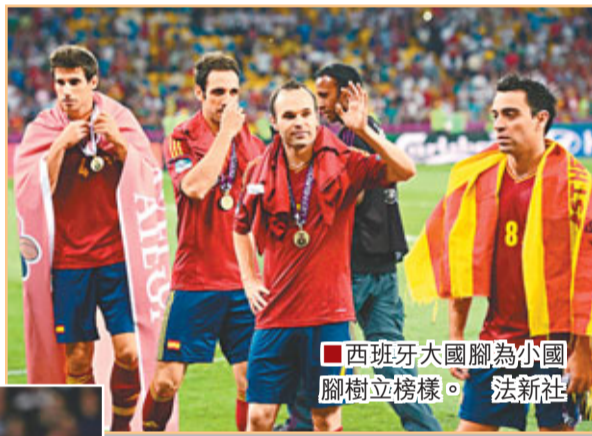
西班牙大國腳為小國腳樹立榜樣。