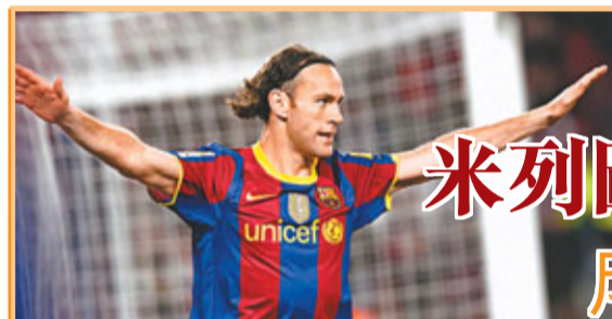
米列圖深明巴塞成功之道。

歐國盃決賽4:0橫掃意大利隊後，西班牙隊成為第一支連續在3屆大賽折桂的球隊，一時風光無人能敵。看着國家隊老大哥們在歐國盃上威風八面，國奧隊小將們也希望在倫敦抓住揚名的機會。「我們當然希望能奪得奧運金牌，尤其是在國家隊獲得歐國盃冠軍以後，」効力於畢爾包隊的穆尼亞因說，「奧運會就像一次冒險，我們目前動力十足。」