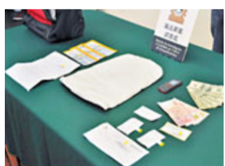
有人把1.4公斤可卡因溶於水，用棉花吸取溶液，再用錫紙包裹，以逃避警方視線，再交該青年偷運。

香港文匯報訊(記者 杜法祖)澳門司警首次揭發毒販以棉花藏毒，一名哥倫比亞青年前日經香港往澳門，準備偷運毒品往內地時，被司警揭發背包暗格內藏一塊用錫紙包裹的棉花。經初步化驗，相信有人把可卡因毒品溶於水，再用棉花吸乾，企圖逃避警方視線。檢獲可卡因重1.4公斤，市值300萬澳門元。