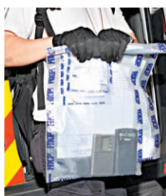
探員在樓上吧檢走用作秤毒的電子磅及毒品。

香港文匯報訊(記者 杜法祖)暑假在即，為了防止樓上吧變成青少年罪惡溫床，警方根據線報，昨日凌晨再度出擊，搜查尖沙咀山道一間早有多次「前科」的樓上吧，拘捕4名包括酒吧負責人及職員在內的毒販和藏毒男女，檢獲可卡因等毒品總值逾3,000元。由於該酒吧已有多次涉及毒品活動紀錄，相信很快會被「釘牌」。