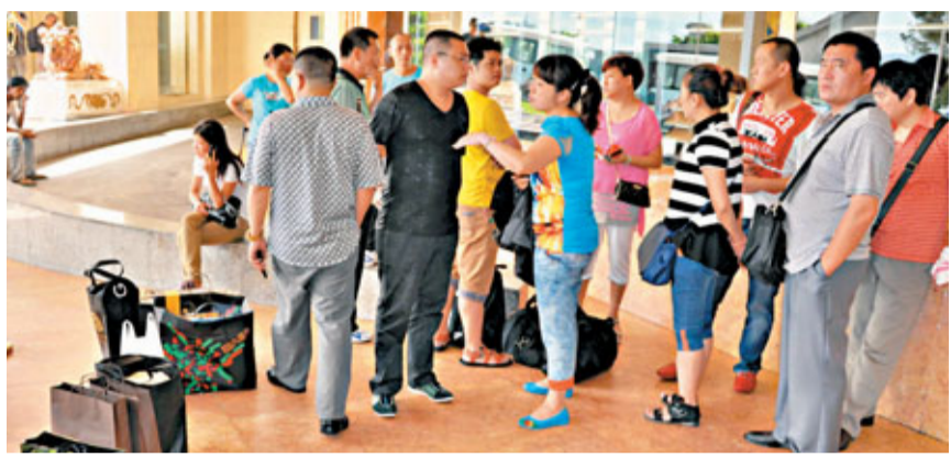
本月2日酒店突短暫停業，大批入住旅客受影響。資料圖片