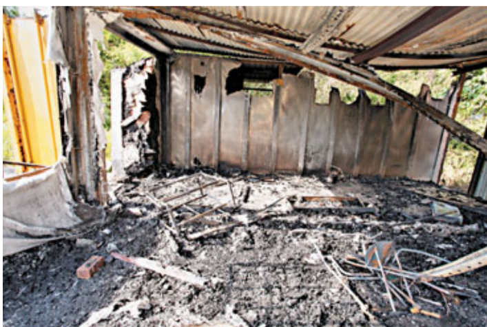
遭縱火的貨櫃屋嚴重焚毀。

香港文匯報訊(記者 杜法祖)北大嶼山發生縱火案，3個位於東涌逸東邨福逸樓對開沙咀頭松滿路海邊的貨櫃，昨中午12時20分，突被街坊發現冒煙起火，火勢迅速蔓延。消防員到場後，開動一條滅火喉，出動煙帽隊灌救，約半小時後把火救熄。消防員在其中一個貨櫃內發現一具狗屍，認為起火原因有可疑，列作縱火案處理，交大嶼山警區刑事調查隊第二隊跟進。