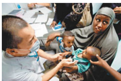
中國醫生在肯尼亞的蒙巴薩為當地兒童看病。

二是西方國家對中國的對非援助非議不斷。由於中國在國情、援助的定位與管理、援助方式方面同西方國家