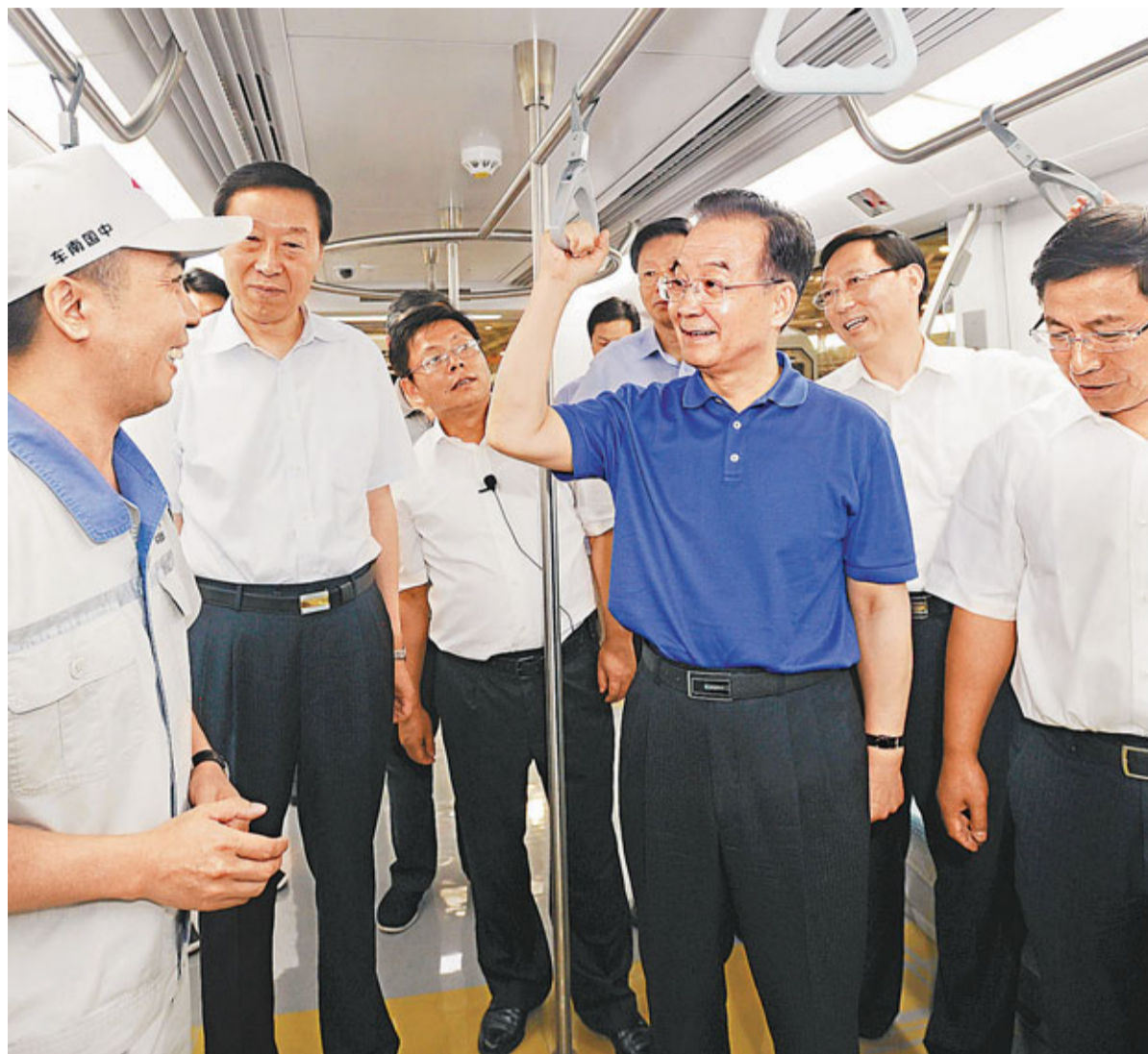
7日，溫家寶在南京浦鎮車輛有限公司生產車間與一線工人交談。

溫家寶強調，擴大內需特別是消費需求是中國經濟長期平穩較快發展的根本立足點。要認真貫徹落實好已經出台的促進消費的政策，以鞏固和增強消費對經濟增長的拉動作用。要實施出口多元化戰略，促進出口穩定增長。當前，穩定投資是擴內需、穩增長的關鍵。要因勢利導，更加注重「轉方式、調結構」，把穩定投資與實施國家中長期發展規劃結合起來，與積極穩妥推進城鎮化結合起來，與保障和改善民生結合起來，與調整經濟結構、淘汰落後產能結合起來，努力實現速度、結構和效益的統一，為更長時期、更高水準、更好品質的發展打下堅實基礎。