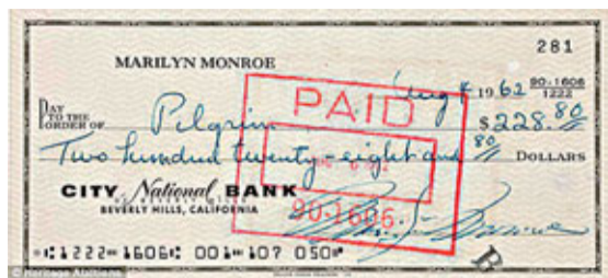
夢露的最後支票公開拍賣。