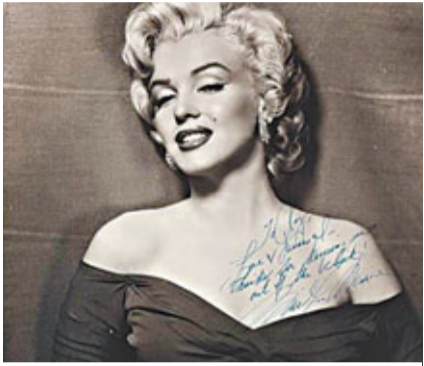
同場拍賣的另一張親筆簽名相。

荷里活一代性感巨星瑪麗蓮夢露50年前一夕殞落，被判定為「可能自殺」，但死因多年來一直惹人猜疑。近日，一張夢露的「最後支票」顯示，她在死前一日曾花228.8美元(約1,774港元)購入一個白色衣櫃；心理學家伯恩斯坦稱，這對一個即將自殺的人來說極不尋常，暗示夢露之死可能並非自殺。