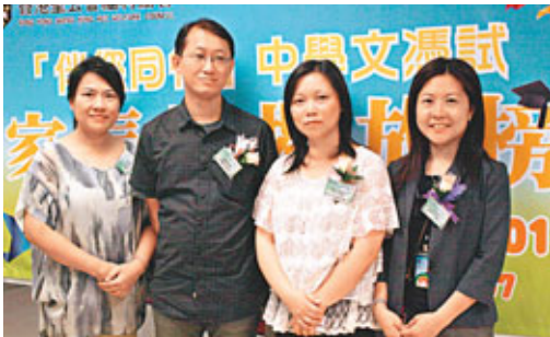
■參加模擬放榜嘉賓為家長和學生提供放榜心理準備。