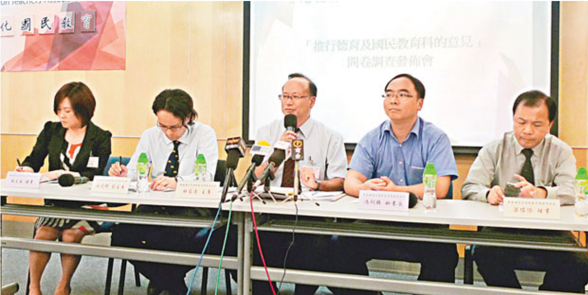
■調查顯示，六成半小學教師及逾四成半中學教師均表示，願意推行德育及國民教育科。

對於近日有該科教材爭議，杜家慶表示，很難有一本教材可涵蓋所有觀點，但認為應採納多元化教材，以求真態度教學，毋需迴避任何話題，該會亦會研究設計關於「六四」的教材。