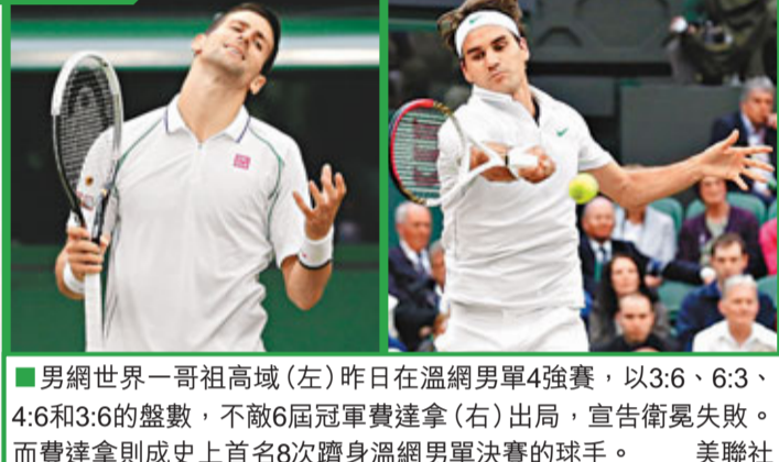
男網世界第一哥祖高域(左)昨日在溫網男單4強賽，以3:6、6:3、4:6和3:6的盤數，不敵6屆冠軍費達拿(右)出局，宣告衛冕失敗。而費達拿則成史上首名8次躋身溫網男單決賽的球手。