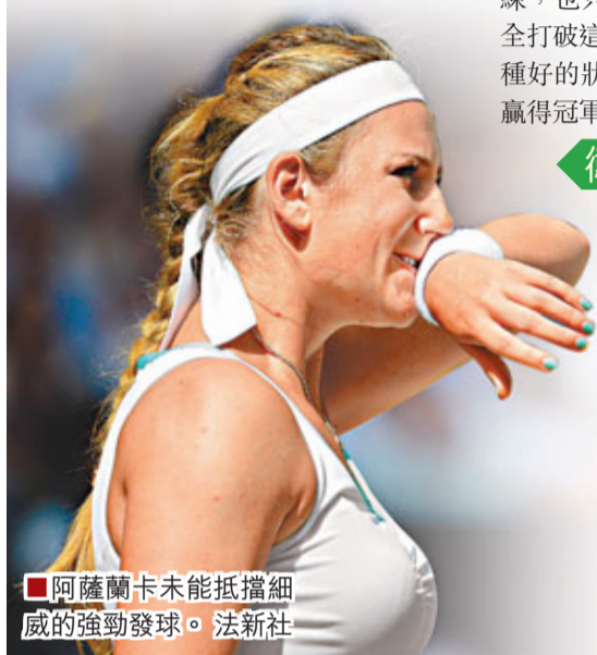
阿薩蘭卡未能抵擋細威的強勁發球。